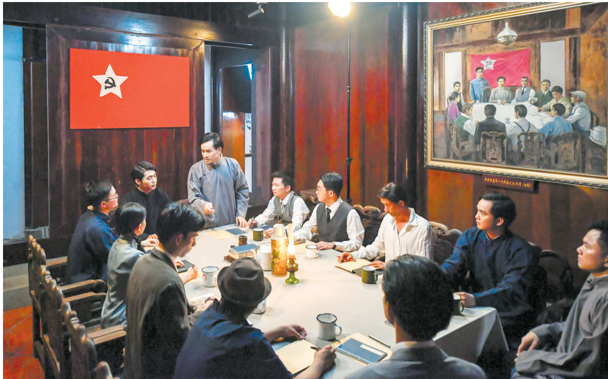
旧址拍摄,再现中共琼崖第一次代表大会在海口召开的场景。