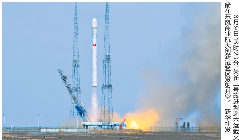
9月6日0时20分,朱雀二号改进型遥六运载火箭在东风商业航天创新试验区发射升空。

6月9日,朱雀二号改进型遥六运载火箭在东风商业航天创新试验区点火升空,以“一箭双星”方式成功将千帆DTC01星和中国移动02星送入预定轨道,发射任务取得圆满成功。