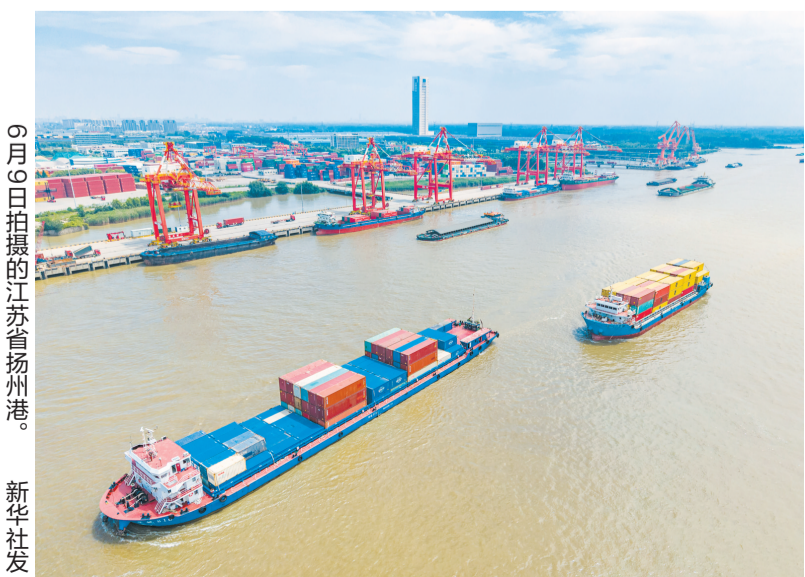
9月6日拍摄的江苏扬州港。

据新华社北京6月9日电(记者邹多为)海关总署9日发布数据显示,今年前5个月,我国货物贸易进出口总值20.68万亿元,同比增速继续上行至15.3%,较前4个月加快0.4个百分点。其中,5月单月进出口4.45万亿元,同比增长较上月扩大2.7个百分点至16.9%。