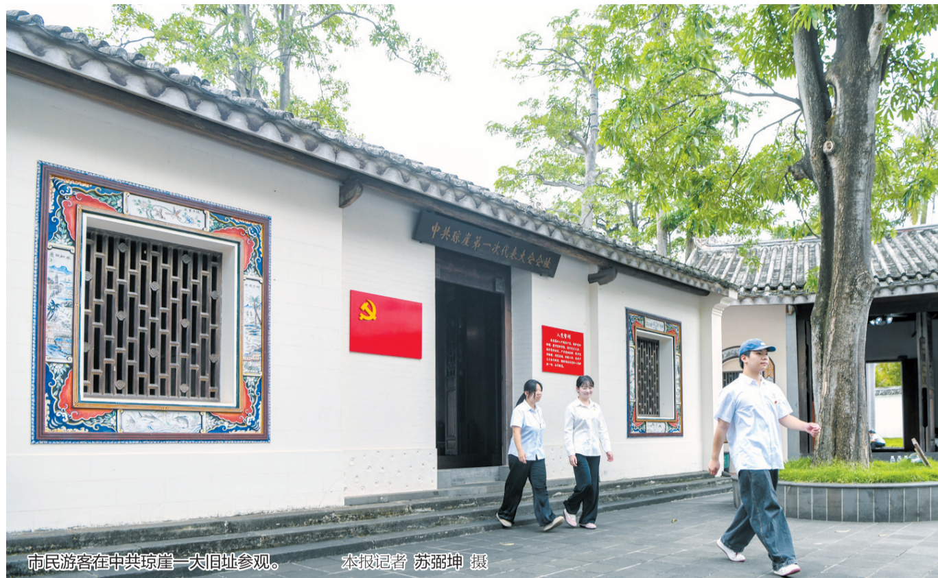
市民游客在中共琼崖一大旧址参观。