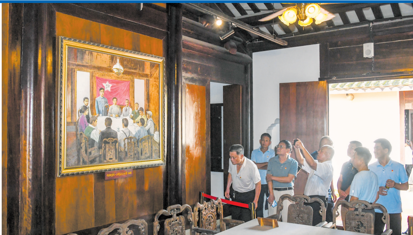
► 市民游客参观中共琼崖一大旧址。