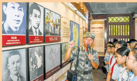
▲ 滨海九小的学生在龙华区新坡镇仁台村参观羊山革命根据地仁台陈列馆。