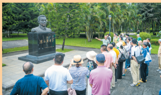
▲ 市民游客在琼山区长泰村冯白驹故居聆听冯白驹将军的革命故事。