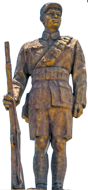
► 琼崖工农红军改编旧址内的战士雕像。