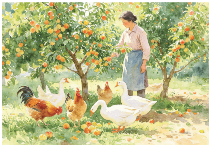
母亲养的家禽。蒙海龙 作

母亲出生在雷州市杨家镇的一个小山村。母亲一生命运多舛，幼年丧父，外婆带着母亲姐妹俩艰难度日，常常衣不蔽体、食不果腹。母亲的继父是一个酒鬼，遇到生活上不顺心的事就喝酒，喝醉了就撒酒疯，对母亲姐妹俩又骂又打。母亲的童年是在缺衣少食，挨打挨骂中熬过。