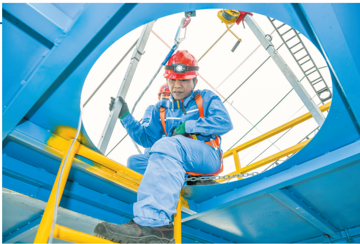
6月23日,在海口市水务系统有限空间作业大练兵活动现场,一线作业人员模拟演练井下作业人员硫化氢中毒窒息突发险情应急处置。

参会企业代表一致表示,本场对接会针对性强、实操性突出,可大幅降低企业对接政策、对接金融资源的时间成本,真切感受到高新区科协立足职能、服务企业、赋能产业的务实举措。下一步,海口国家高新区科协将持续以各类资源对接活动为抓手,激活园区创新主体活力,夯实自贸港科创产业支撑,为海南自由贸易港高质量发展贡献高新区科协力量。