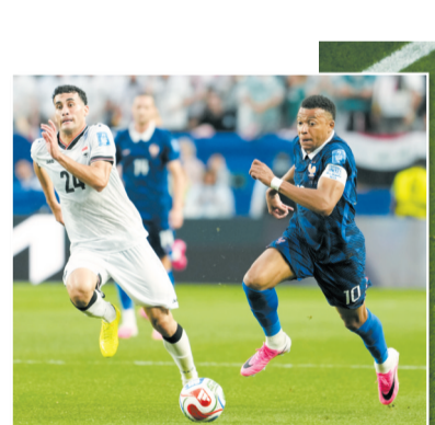
▲当地时间6月22日,美加墨世界杯I组小组赛,法国队对阵伊拉克队。法国队球员姆巴佩(右)在比赛中带球突破。

J组另一场比赛中,“新军”约旦队在一球领先的情况下遭阿尔及利亚队2:1逆转,两场小组赛提前出局。