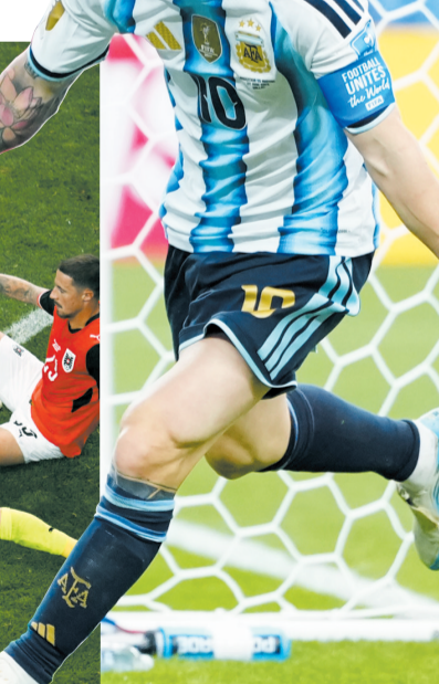
▲当地时间6月22日,美加墨世界杯J组小组赛中,阿根廷队2比0战胜奥地利队。阿根廷队球员利昂内尔·梅西(左二)在比赛中射门得分。