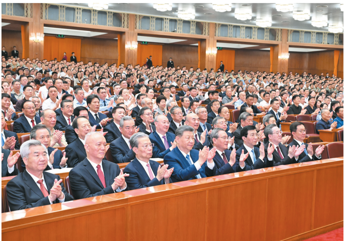
6月29日晚，庆祝中国共产党成立105周年音乐会《人民至上》在北京举行。习近平、李强、赵乐际、王沪宁、蔡奇、丁薛祥、李希、韩正等党和国家领导人，同约3000名观众一起观看演出。

新华社北京6月29日电 深情乐章致敬辉煌历程，嘹亮歌声唱响人民史诗。庆祝中国共产党成立105周年音乐会《人民至上》29日晚在京举行。习近平、李强、赵乐际、王沪宁、蔡奇、丁薛祥、李希、韩正等党和国家领导人，同约3000名观众一起观看演出，共同庆祝这个光辉的节日。