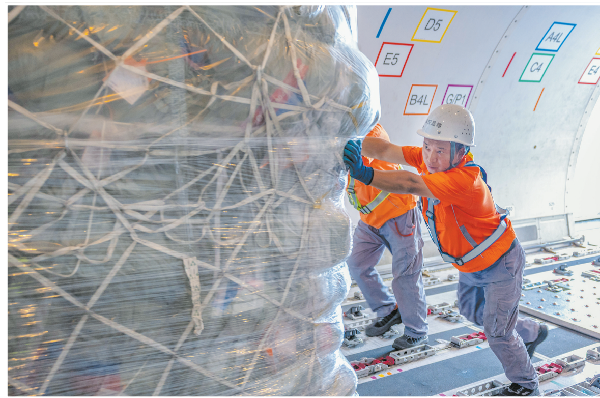
7月1日,在海口美兰国际机场,由格鲁吉亚航空运营的“第比利斯—特拉维夫—海口”的货运航线恢复。图为工作人员正在给B767全货机装载货物。

据悉,今年上半年,海口美兰机场累计完成国际货邮吞吐量约1.68万吨,同比增长58.61%。