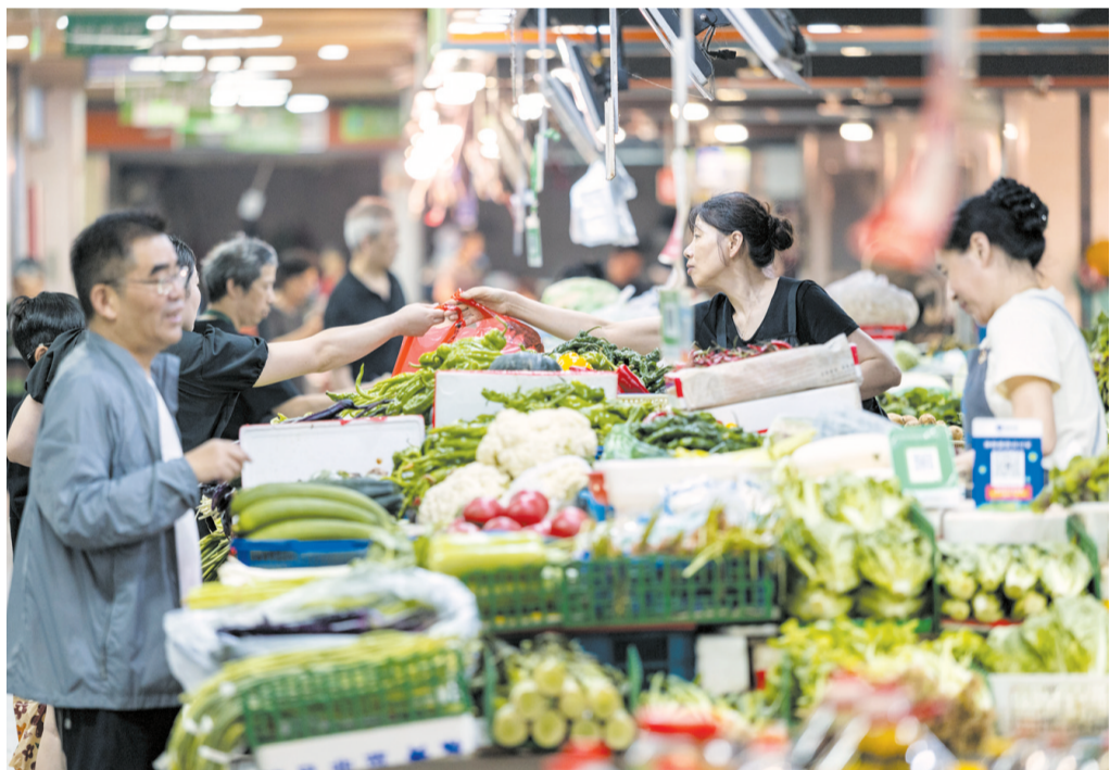
7月9日,市民在浙江省湖州市吴兴区中心农贸市场选购蔬菜。