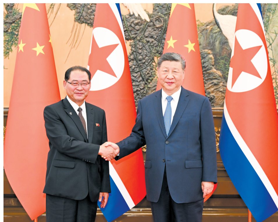
7月10日下午，中共中央总书记、国家主席习近平在北京人民大会堂会见来华进行正式访问的朝鲜劳动党中央政治局常委、国务委员会副委员长、内阁总理朴泰成。

新华社北京7月10日电(记者曹嘉玥)7月10日下午，中共中央总书记、国家主席习近平在北京人民大会堂会见来华进行正式访问的朝鲜劳动党中央政治局常委、国务委员会副委员长、内阁总理朴泰成。